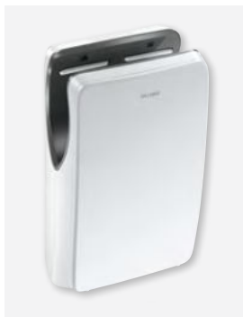
Blanco mate Ref. DELABIE: 510624W