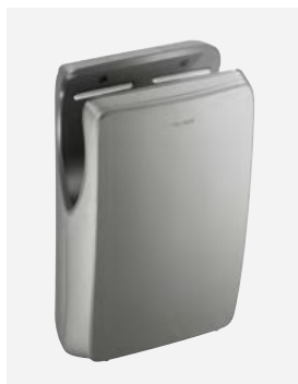
Antracita metalizado Ref. DELABIE: 510624C