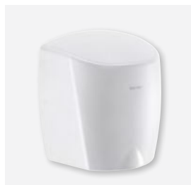
Epoxi blanco Ref. DELABIE: 510622W