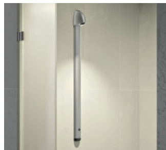
Exemple d'installation, colonne de douche automatique SPORTING 2 SECURITHERM

Organisés tous les 2 ans, ces salons auront lieu du lundi 03 au jeudi 06 octobre, au Parc des Expositions Porte de Versailles.