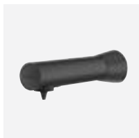
Distributeur automatique de savon liquide ou gel hydroalcoolique

Nouveau distributeur de savon automatique noir mat