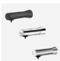
Design : disponible en 3 finitions