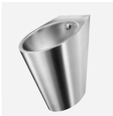
Urinoir design Inox FINO Réf. DELABIE : 135710

Illustrations disponibles sur notre site internet delabie.fr , rubrique Presse